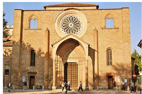
San Francesco a Lodi