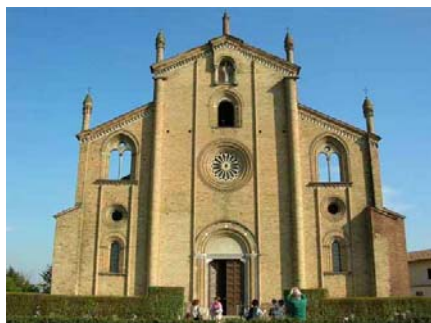
San Bassiano a Lodivecchio

(Nelle facciate delle contemporanee chiese di S. Bassiano a Lodivecchio, di S. Francesco a Lodi, del Duomo di Crema e di S. Agostino a Cremona ritroviamo l'uso dello stesso modello compositivo, anche se con qualche adattamento.)