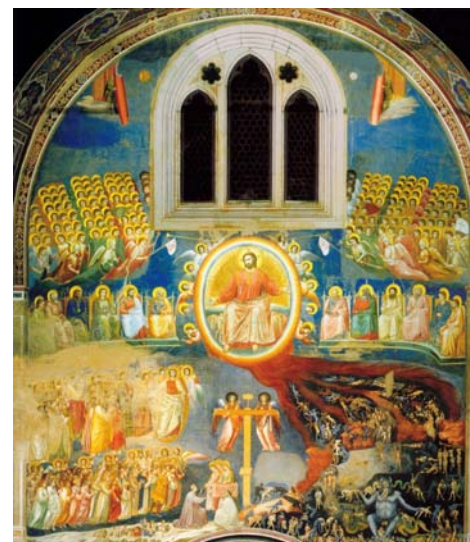
La decorazione della scena del Giudizio Universale di Giusto a Viboldone si modella chiaramente su quella che Giotto affrescò per Enrico Scrovegni nella cappella di S.Maria della carità a Padova. (vedi figura qui a fianco)

Sulla metà superiore della parete, ai lati due angeli sono intenti ad arrotolare il padiglione celeste, mettendo così in mostra lo splendore della Gerusalemme nuova (Ap 21,1). In basso, alla sinistra, i dannati, colpiti da diverse pene, secondo la legge del contrappasso (Mt 25, 41-43); al centro giganteggia la figura di satana, intento a divorare la sua preda.